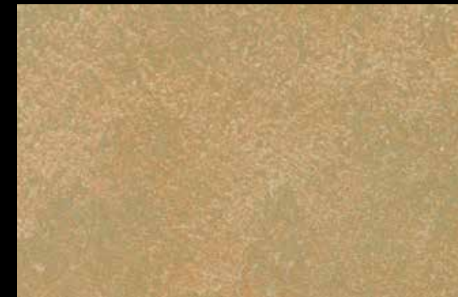
458 A + GOLD G 100