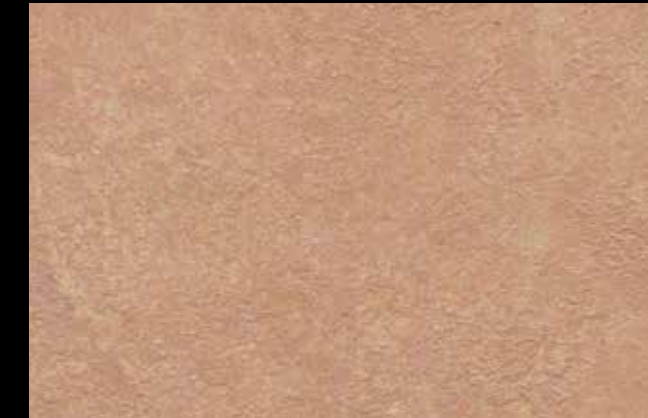
452 A + SILVER G 200