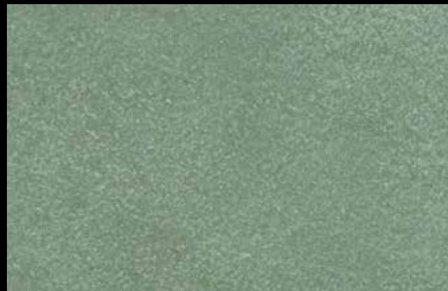
453 A + GOLD G 100