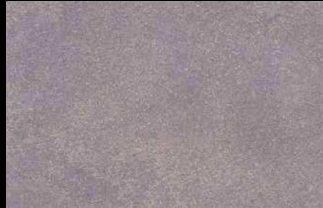
445 A + SILVER G 200