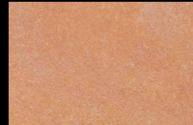
452 A + GOLD G 100