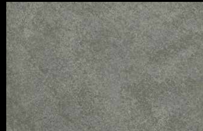
448 A + GOLD G 100