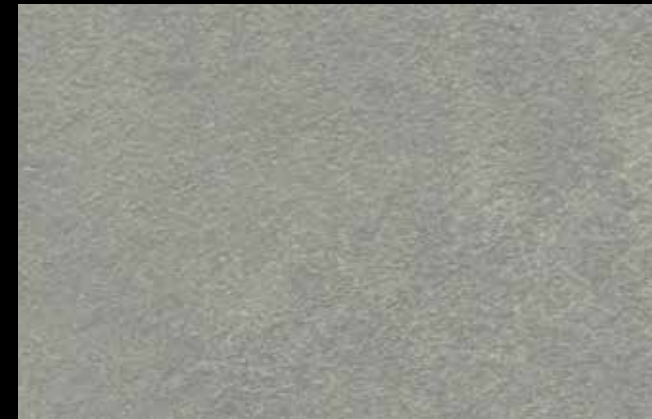
425 A + SILVER G 200