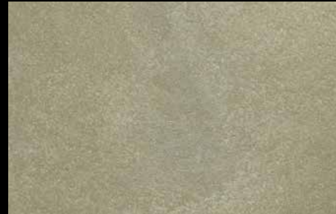
466 A + SILVER G 200