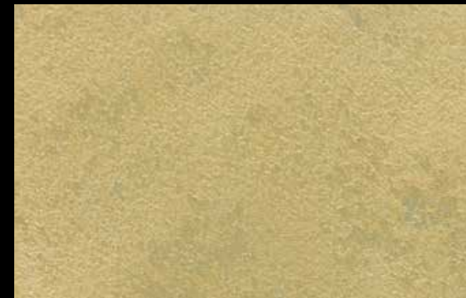
459 A + GOLD G 100