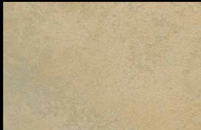
474 A + GOLD G 100