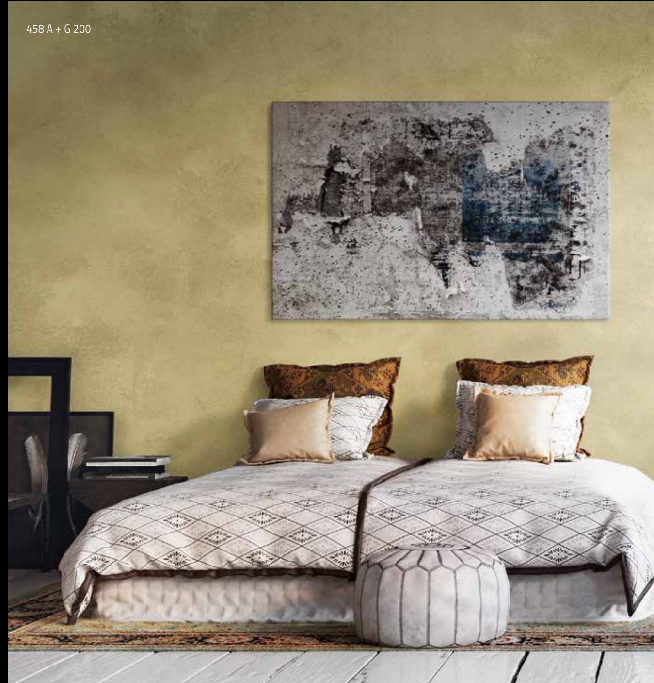
458 A + G 200