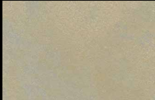
474 A + SILVER G 200