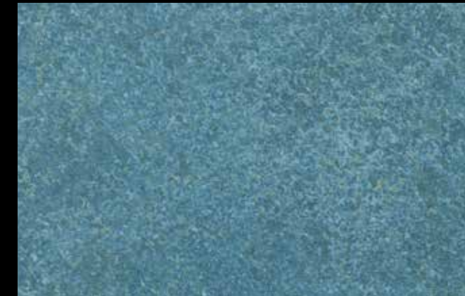
428 A + GOLD G 100