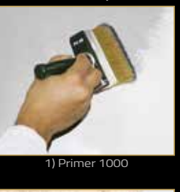
1) Primer 1000