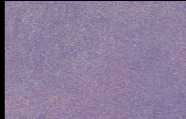
429 A + SILVER G 200