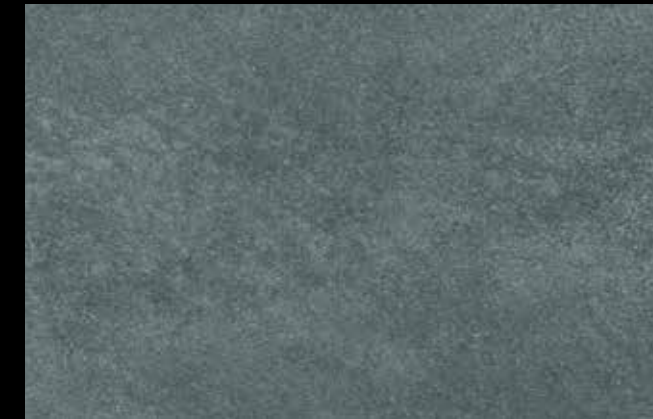
451 A + SILVER G 200