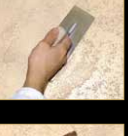
3) Klondike Light