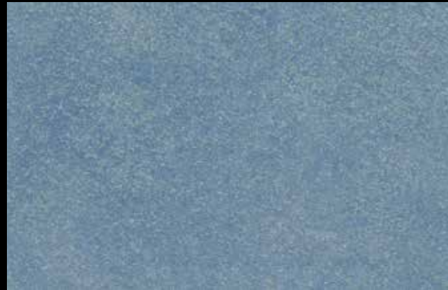
446 A + SILVER G 200