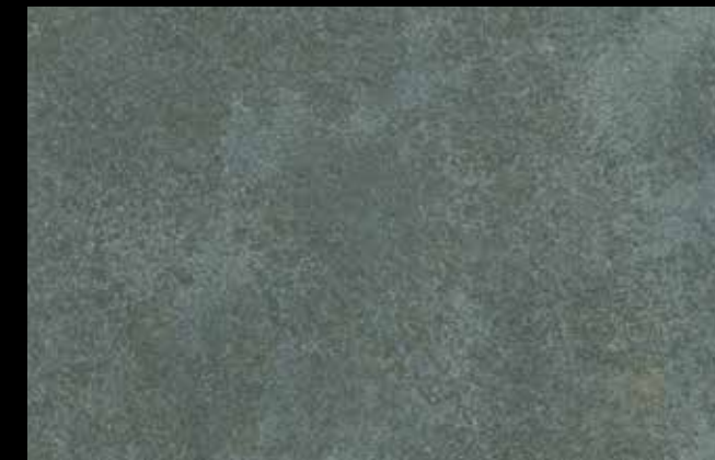
451 A + GOLD G 100