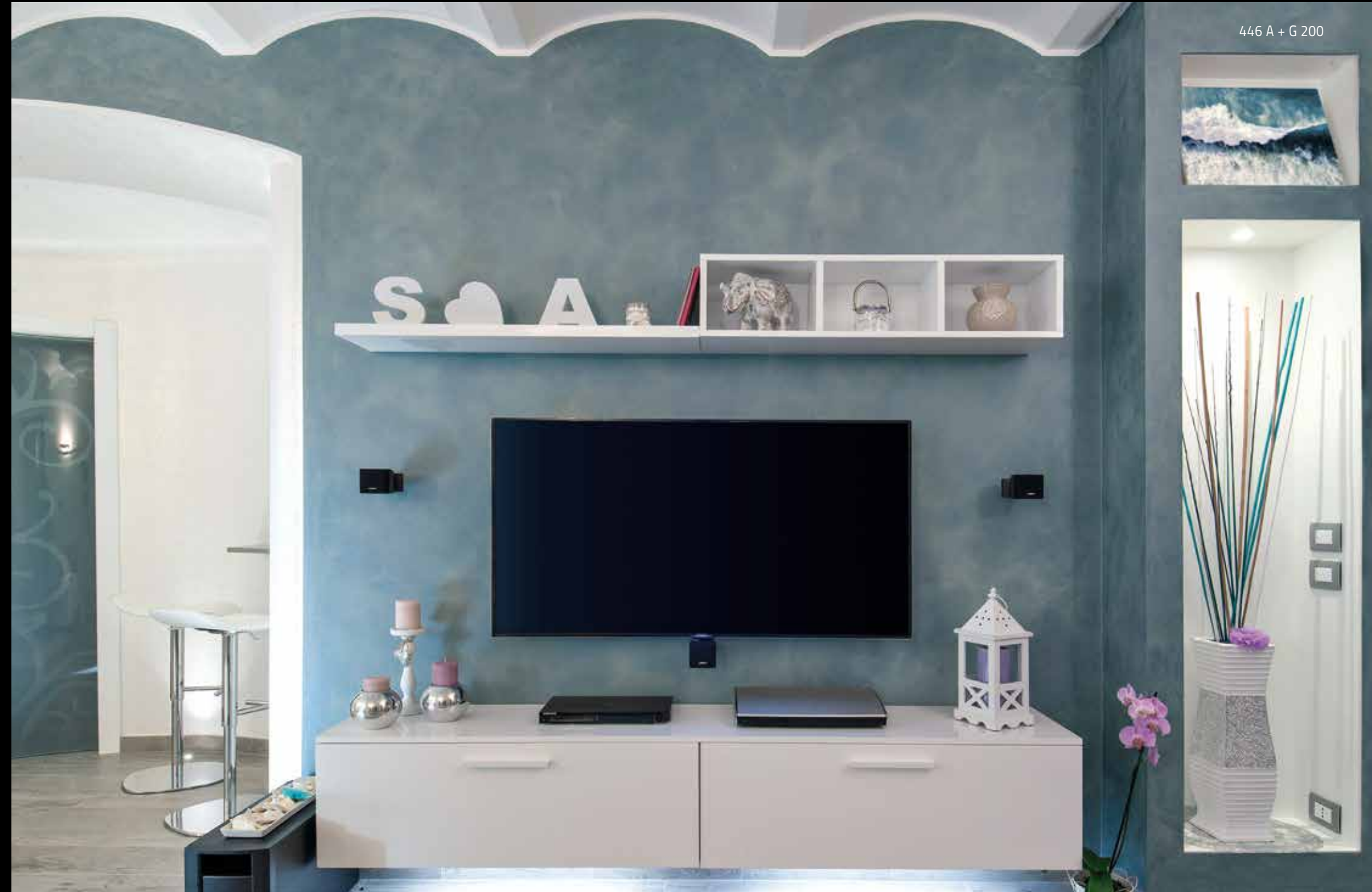
446 A + G 200