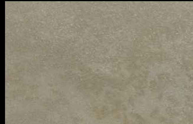
467 A + GOLD G 100