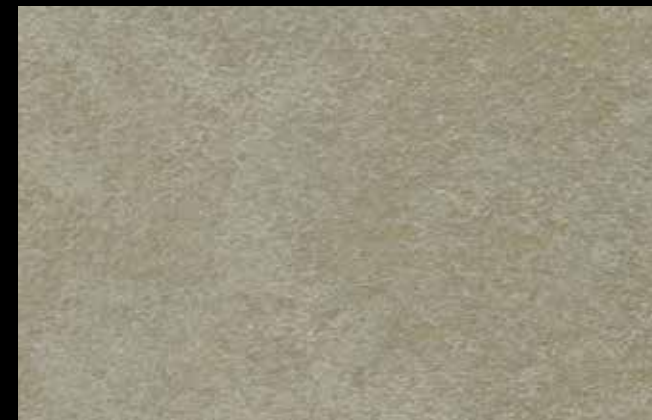
425 A + GOLD G 100