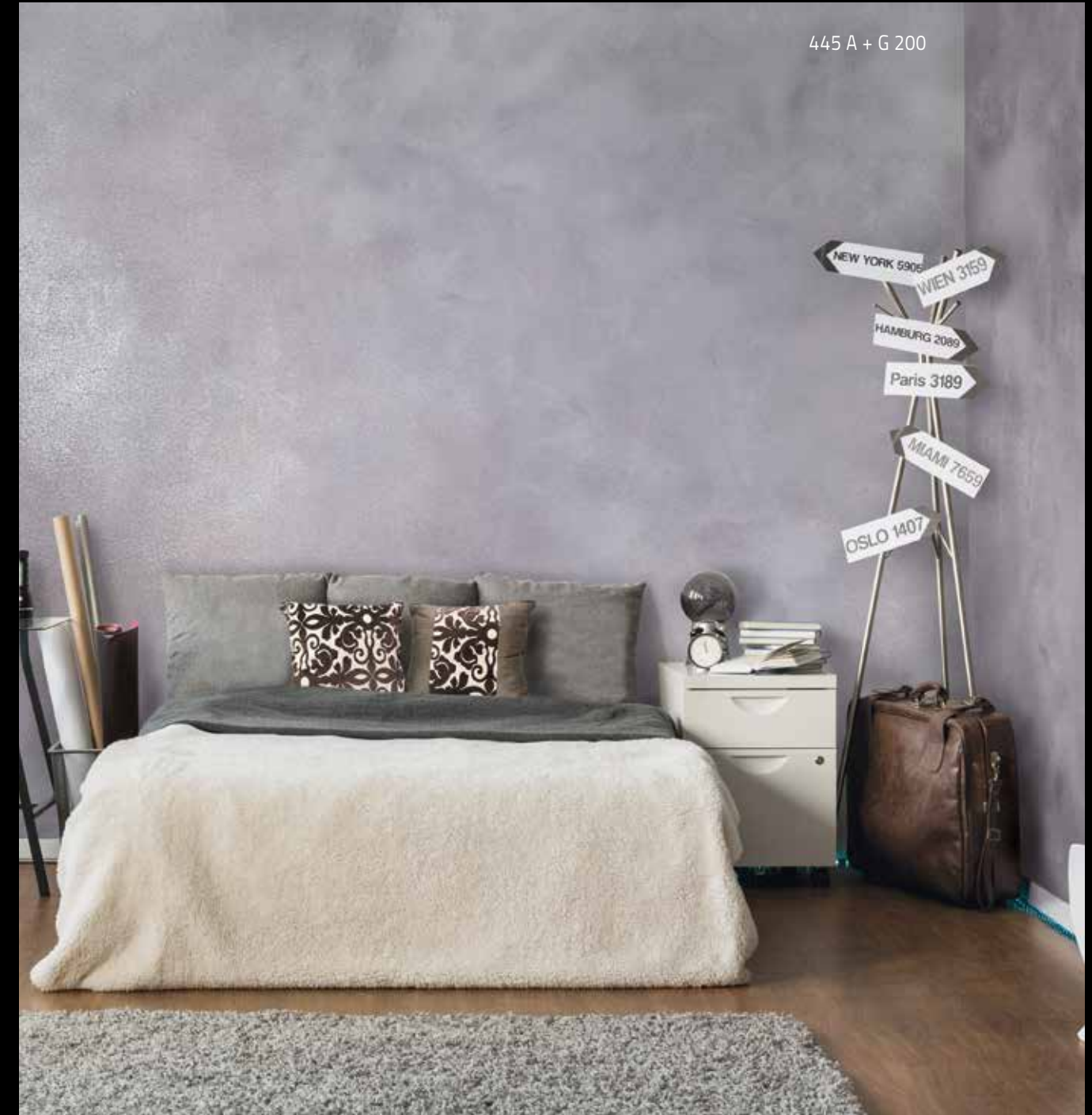
445 A + G 200