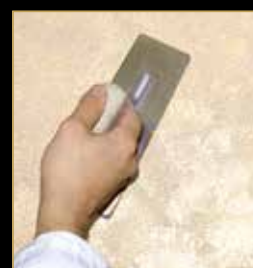
3) Klondike Light