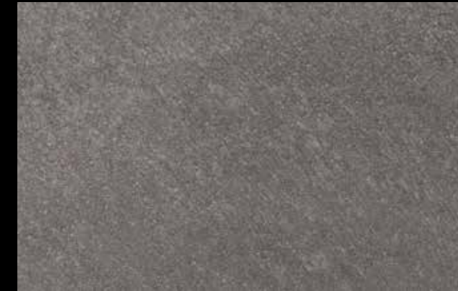
461 A + SILVER G 200