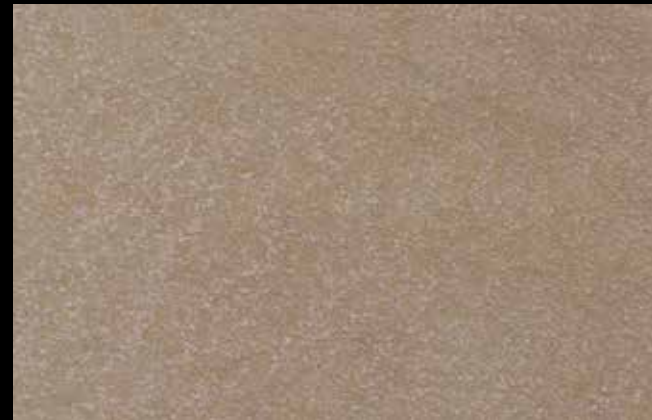
445 A + GOLD G 100