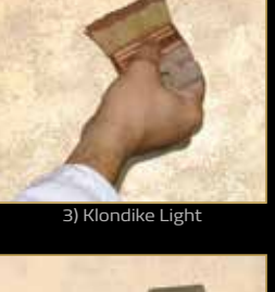
3) Klondike Light