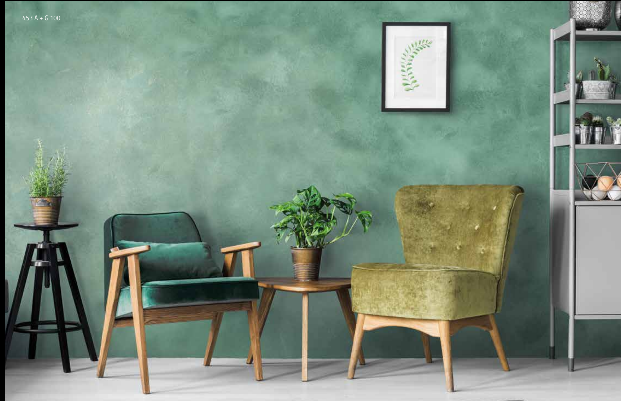
453 A + G 100