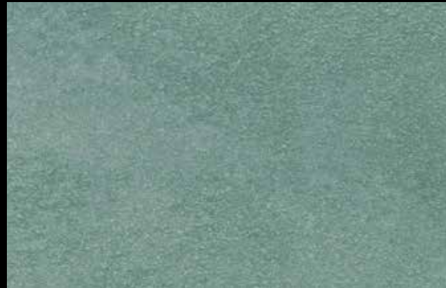
453 A + SILVER G 200