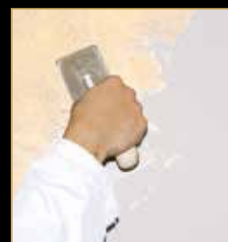
2) Klondike Light