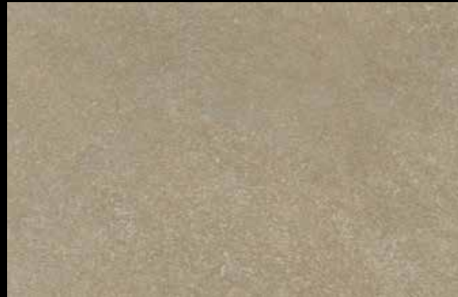
469 A + SILVER G 200