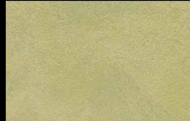
459 A + SILVER G 200