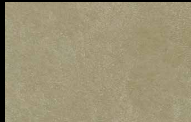
466 A + GOLD G 100