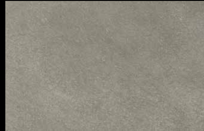
467 A + SILVER G 200