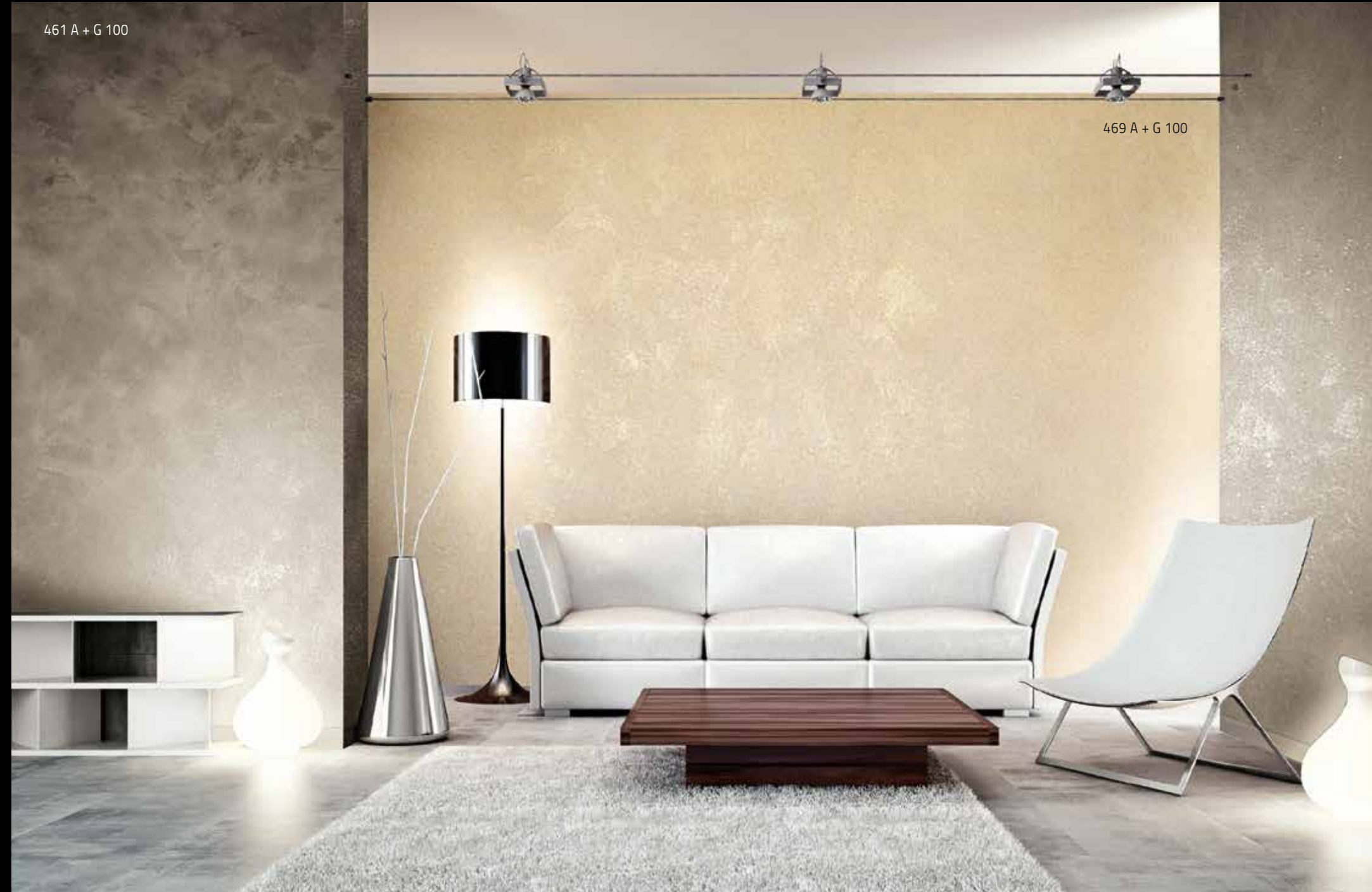
461 A + G 100