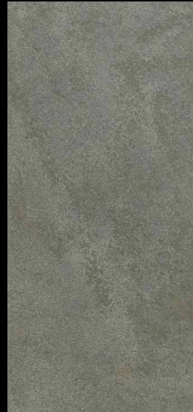
448 A + GOLD G 100 + STAR G 300