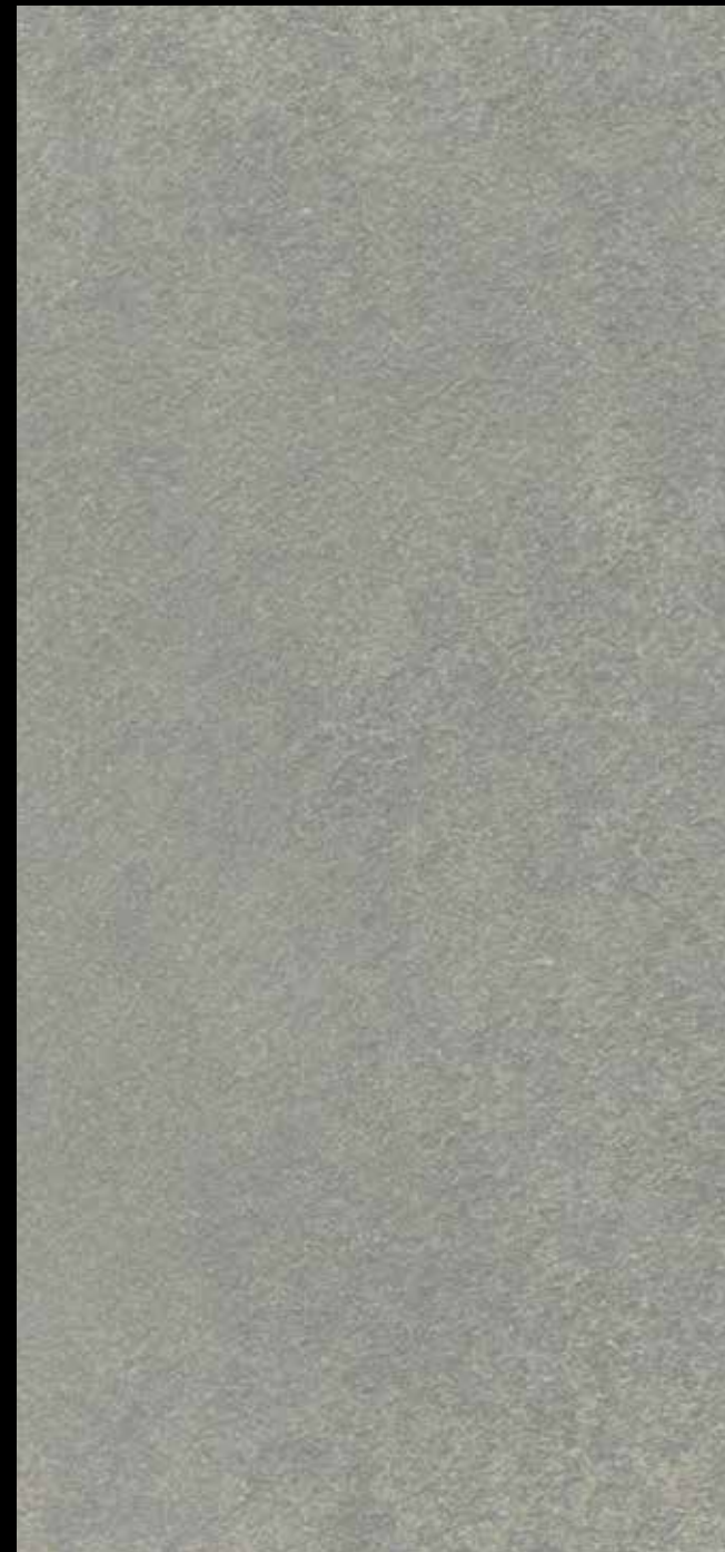
425 A + SILVER G 200 + STAR G 300