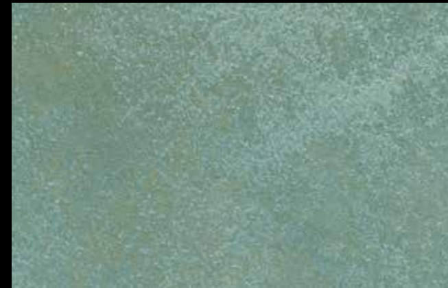
447 A + GOLD G 100