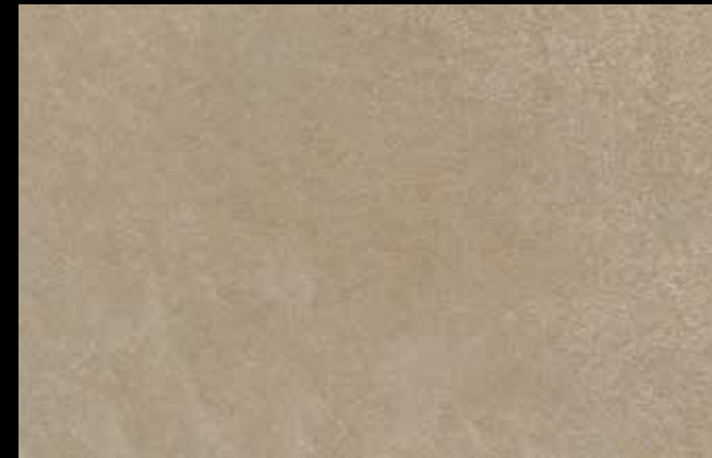
475 A + GOLD G 100