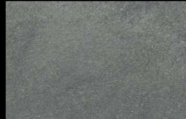
448 A + SILVER G 200