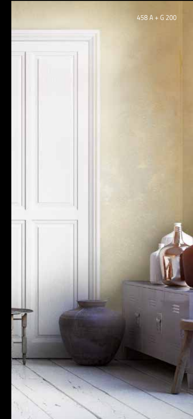
458 A + G 200