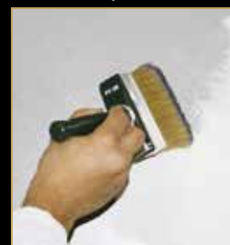
1) Primer 1000