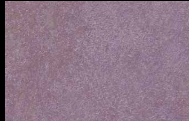
429 A + GOLD G 100