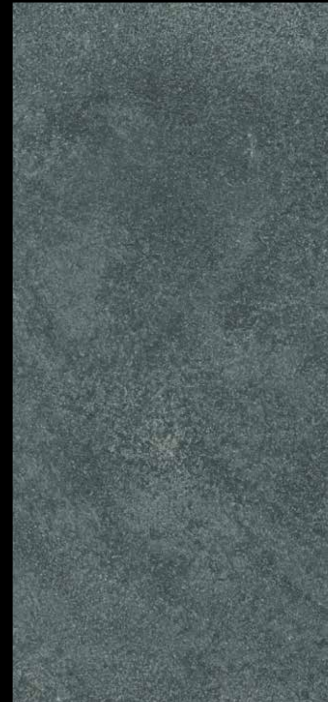
451 A + STAR G 300