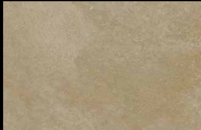
469 A + GOLD G 100