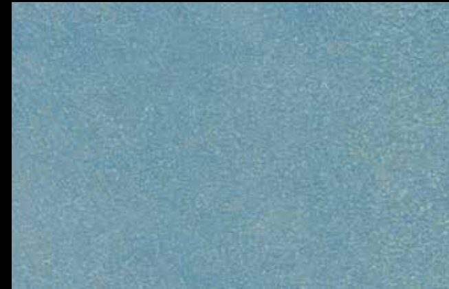
447 A + SILVER G 200