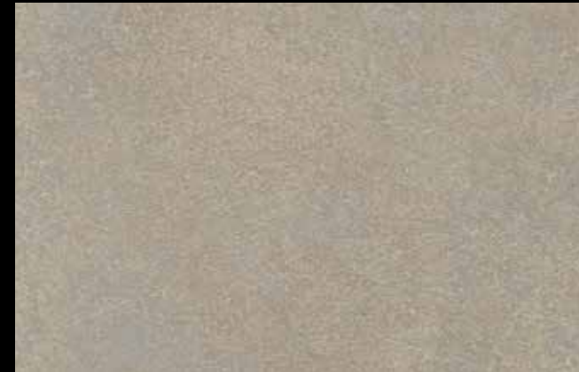
475 A + SILVER G 200