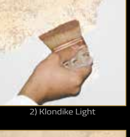
2) Klondike Light