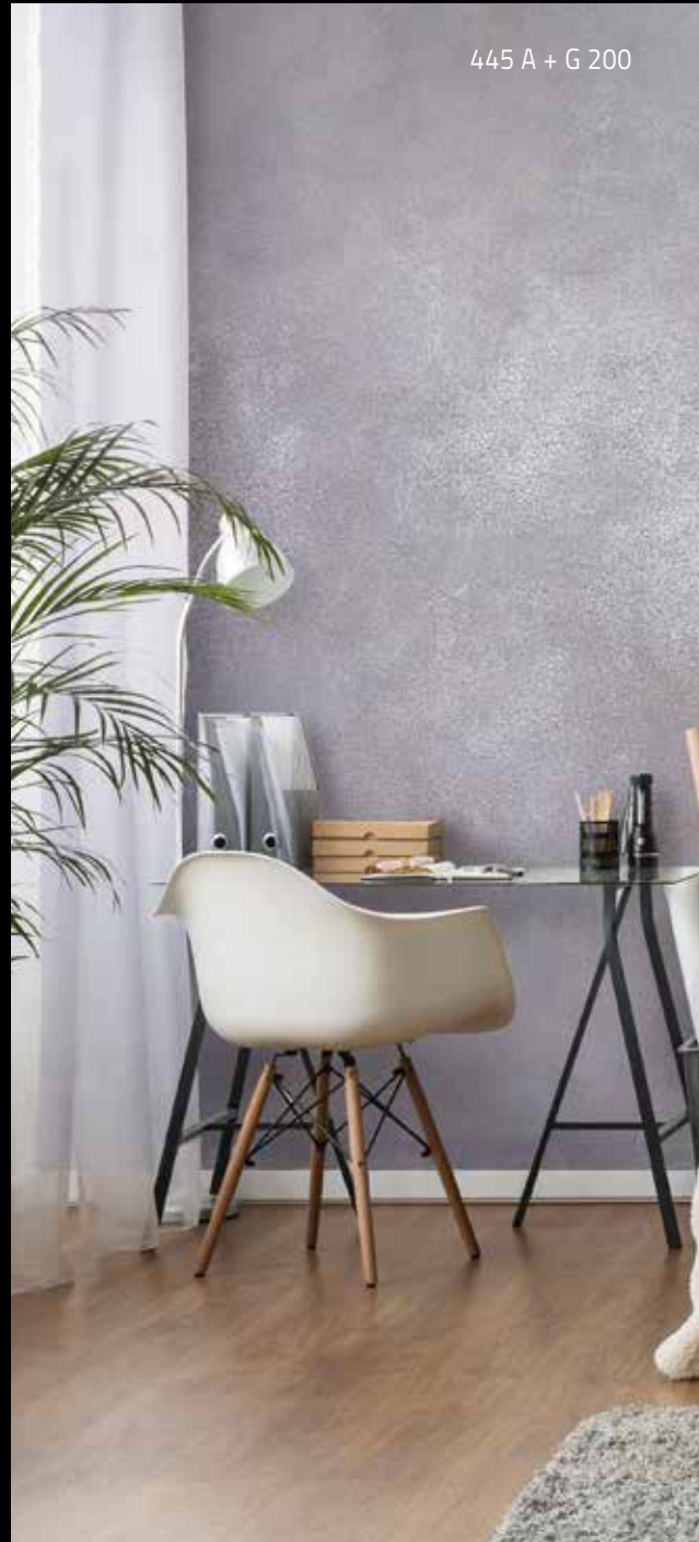
445 A + G 200