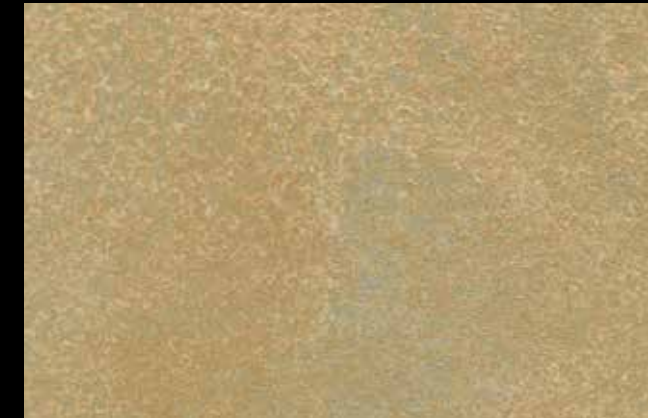
458 A + SILVER G 200