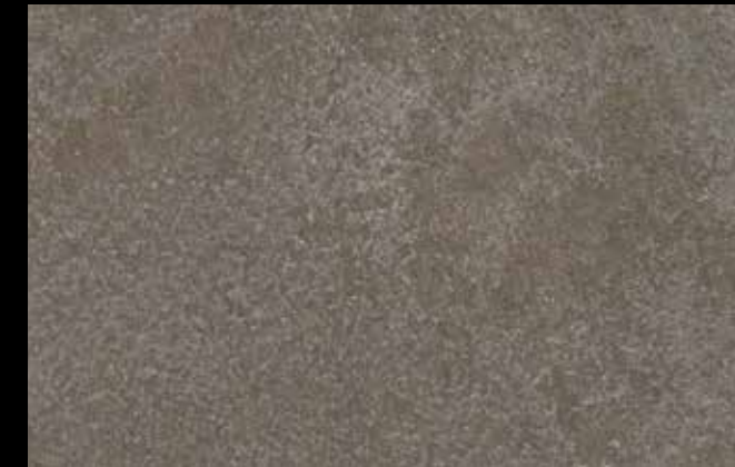
461 A + GOLD G 100