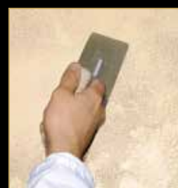
3) Klondike Light