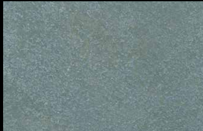
446 A + GOLD G 100